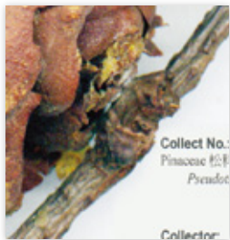
ObjectScan 1600 掃描影像

ObjectScan 1600 配備有一相當於 10 億畫素的 1600 dpi 彩色線性 CCD，再搭上內建 48 位元的類比數位轉換器 (ADC)，無論是標本整體或是表面細節，都能精準取像呈現。